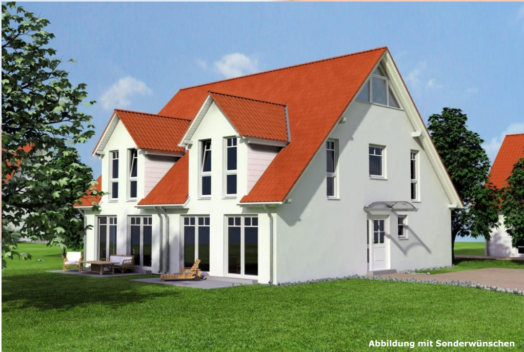
Abbildung mit Sonderwünschen

Viel Platz für wenig Geld: Im komfortablen Doppelhaus können sich zwei Familien bestens entfalten – selbst auf einem kleinen Grundstück. Im Dachgeschoss sorgen die großen Gauben für viel Lichteinfall.