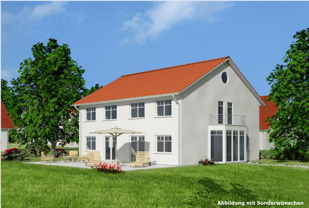
Abbildung mit Sonderwünschen

Ein Haus – zwei Varianten: Ein gutes Beispiel dafür, wie durch optimale Planung auf individuelle Wünsche reagiert werden kann. Durch den flexiblen und großzügigen Grundriss lassen sich die Bedürfnisse der ganzen Familie individuell erfüllen.