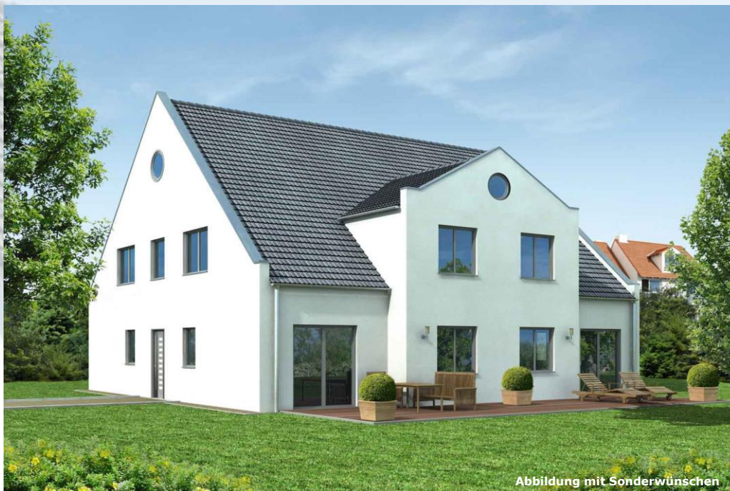
Abbildung mit Sonderwünschen

Ein Stück Lebensqualität: Der dritte Giebel und die Dachgauben bewirken eine exklusive Ausstrahlung. Herzstück ist das Treppenhaus. Durch die große Diele und den offenen Wohn- und Kochbereich erfüllen sich alle Wünsche.