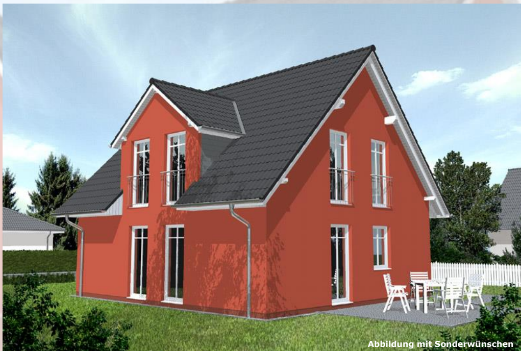
Abbildung mit Sonderwünschen

Ein Traum an Raum: Bereits die Einsteigerversion erfüllt alle Wünsche an ein Zuhause, auf das man sich immer wieder aufs Neue freut. Als besonders attraktiv erweist sich die architektonische Linienführung.